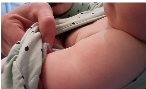
Amélioration pendant le protocole