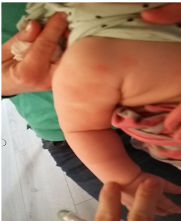
Avant protocole de soin